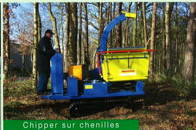
Chipper sur chenilles

Les différents types de machines du H5 au H10 peuvent broyer des bois de diamètre d'env. 160 mm jusqu'à 270 mm. Les avantages obtenus résident principalement dans la réduction de volume et dans la préparation à la valorisation ultérieure .