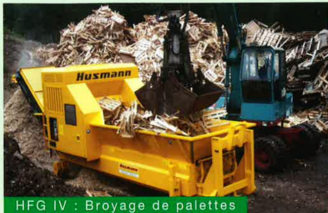
HFG IV : Broyage de palettes

Les broyeurs rapides à marteaux de la série HFG produisent des broyats propres, fins, et de qualité constante, lors du broyage de produits organiques grâce à leur technique spécifique de broyage , la définition des grilles de calibrage , et la disposition des marteaux .