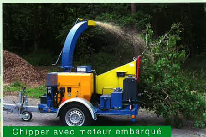
Chipper avec moteur embarqué

Les différentes machines du H4 au H10 peuvent réduire des troncs de diamètre 140 à 270 mm. Les avantages consistent non seulement en la réduction des volumes , mais aussi la préparation des traitements ultérieurs .