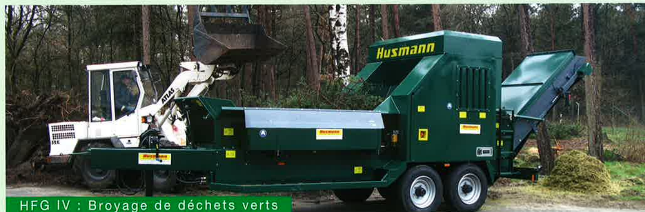
HFG IV : Broyage de déchets verts

Le produit à traiter comme p. ex. les déchets verts, ou les branchages, est défibré en profondeur par la technique de broyage et il convient parfaitement au compostage.