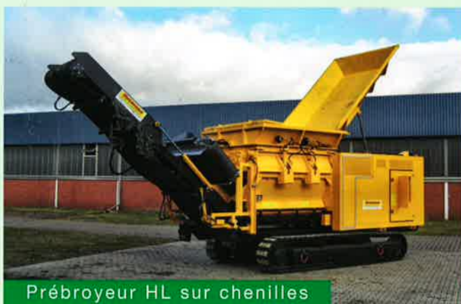
Prébroyeur HL sur chenilles