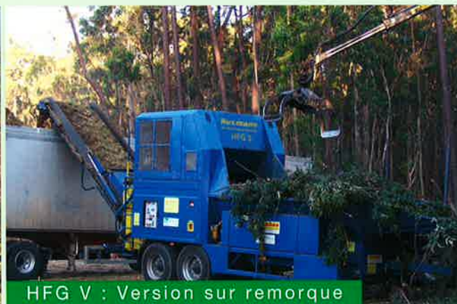
HFG V : Version sur remorque

Le produit à traiter comme p. ex. les déchets verts, ou les branchages, est défibré en profondeur par la technique de broyage et il convient parfaitement au compostage.