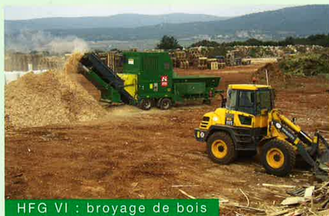
HFG VI : broyage de bois