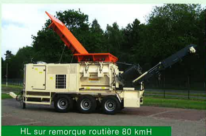
HL sur remorque routière 80 km/h

Suivant le gisement à broyer, des outils spéciaux, ou des racleurs peuvent être utilisés, de manière à optimiser le travail et le résultat désiré , ainsi que le débit .