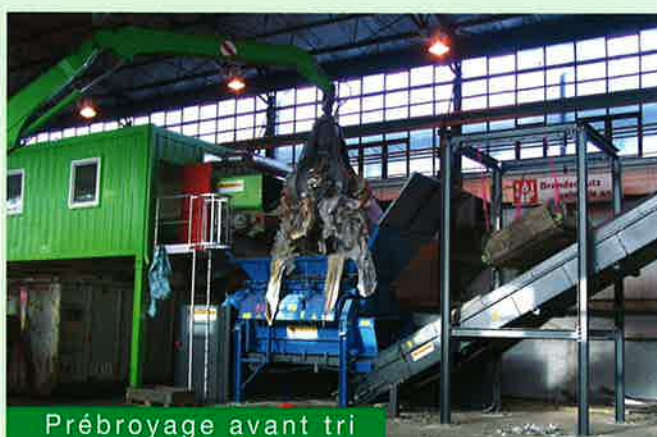
Prébroyage avant tri

Des équipements complémentaires tels que le déferrailleur Overband, le train de chenilles, ou la radiocommande, complètent les possibilités de mise en œuvre de la machine, facilitent le travail , et apportent la solution optimale à l'application requise.