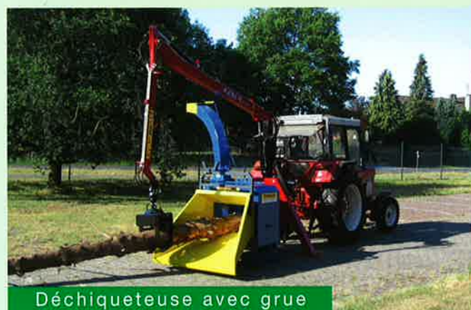
Déchiqueteuse avec grue