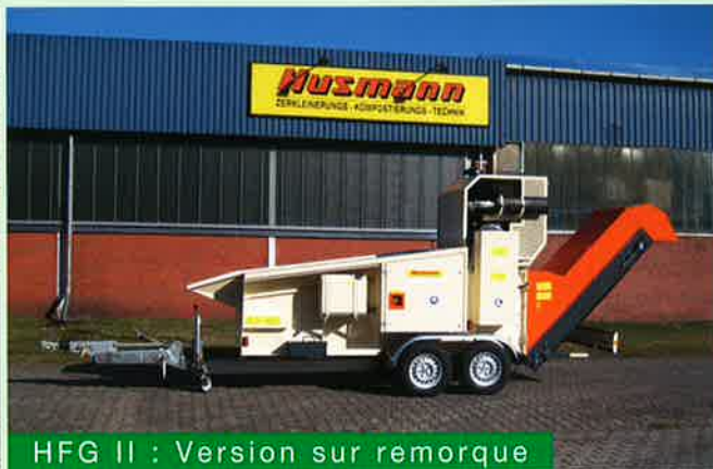
HFG II : Version sur remorque