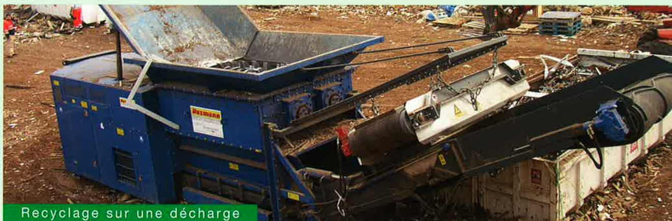
Recyclage sur une décharge

Dans notre département ingénierie technique, les prébroyeurs type HL sont complétés par des équipements d' alimentation et de traitement ultérieur spécialement adaptés aux conditions du site et aux spécificités du broyage.