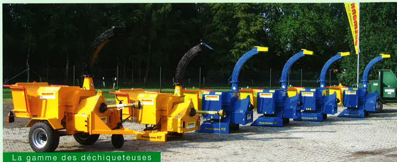
La gamme des déchiqueteuses

Les déchiqueteuses à bois travaillent suivant le principe de la coupe . Les chippers Husmann existent en différentes tailles et avec divers modes de motorisation .