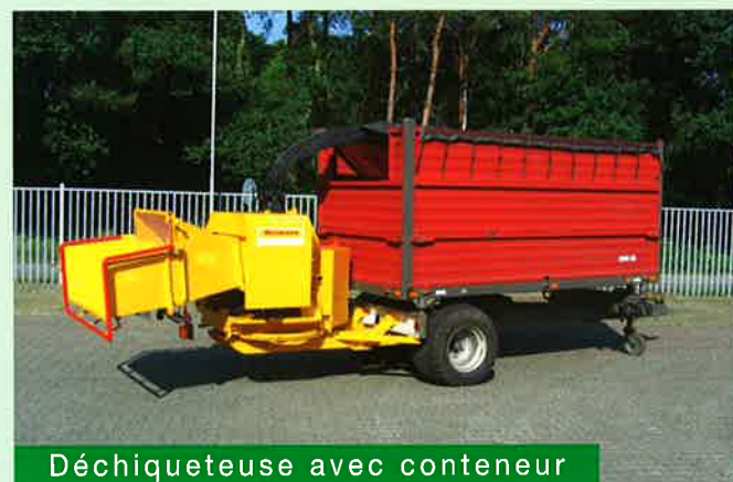
Déchiqueteuse avec conteneur

Les différentes machines du H4 au H10 peuvent réduire des troncs de diamètre 140 à 270 mm. Les avantages consistent non seulement en la réduction des volumes , mais aussi la préparation des traitements ultérieurs .