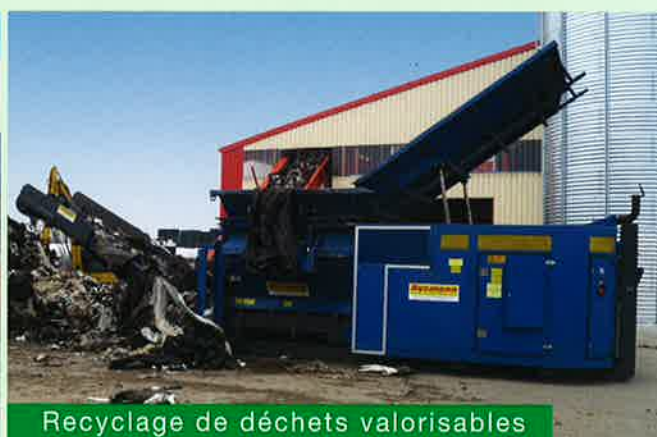
Recyclage de déchets valorisables

Suivant le gisement à broyer, des outils spéciaux, ou des racleurs peuvent être utilisés, de manière à optimiser le travail et le résultat désiré , ainsi que le débit .